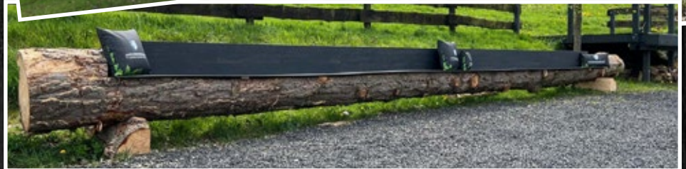
Nehmt Platz und staunt – Die längste Schützenbank im Stadtgebiet.